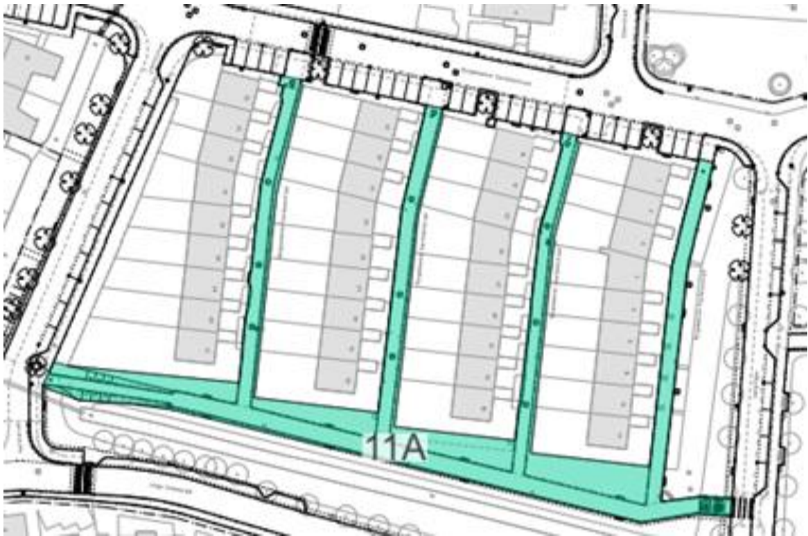
Figuur 1 Hofjes Burgemeester Kasteleinstraat