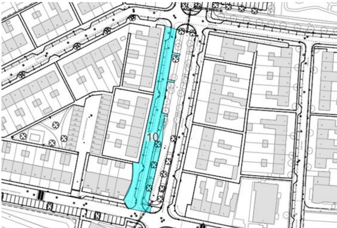
Figuur 1 Herfststraat

Lycke Hoogeveen Omgevingsmanager Gemeente Amsterdam